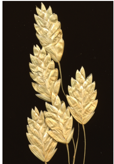
Abb. 1: Bromus briziformis , Ährchen des Blütenstandes, NHG 24221

Eine durch obiges Literaturstudium ausgelöste Durchsicht des Herbars an der Naturhistorischen