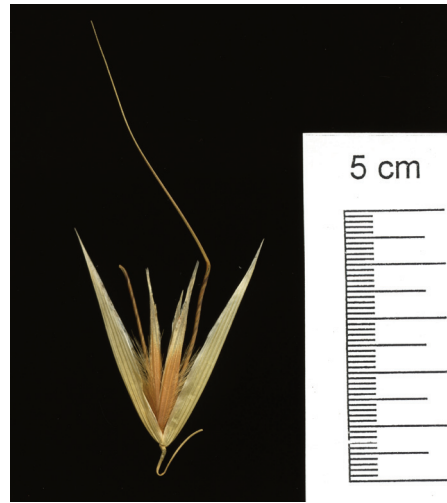
Abb. 3: Avena sterilis subsp. sterilis Ährchen, NHG 24893

Die weitere Entwicklung geht über den Kultur-Hafer hin zu Avena fatua , dem Flug-Hafer (SCHOLZ 1991). Die 2 - 5-blütigen Ährchen von Avena sterilis sind bis 5 cm lang; die Granne der Deckspelze kann bis 9 cm lang werden (Abb. 3).