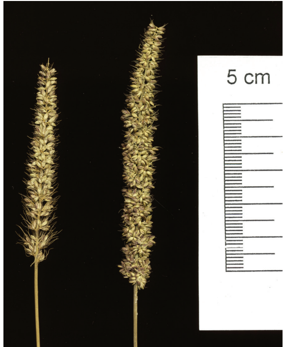
Abb. 5: Setaria verticilliformis links und Setaria verticillata rechts, Blütenstand, NHG 9132 und 25809

Die Flora des Regnitzgebietes (GATTERER et al. 2003) enthält für beide Borstenhirsen nur eine gemeinsame Verbreitungskarte, so dass die Fundorte nicht den einzelnen Arten (früher Varietäten) zugeordnet werden können. Setaria verticilliformis (unter Setaria verticillata var. ambigua ) wird aktuell als „selten verschleppt“ ohne Fundortangabe bezeichnet. Die einzigen bekannten, rezenten Vorkommen stammen aus Bamberg und westlich davon (Rainer Otto, mündlich, siehe auch MEIEROTT 2008). Die historischen Angaben werden auch für diese Art hier erstmals durch Belege des „Schwarz-Herbars“ bestätigt. 5