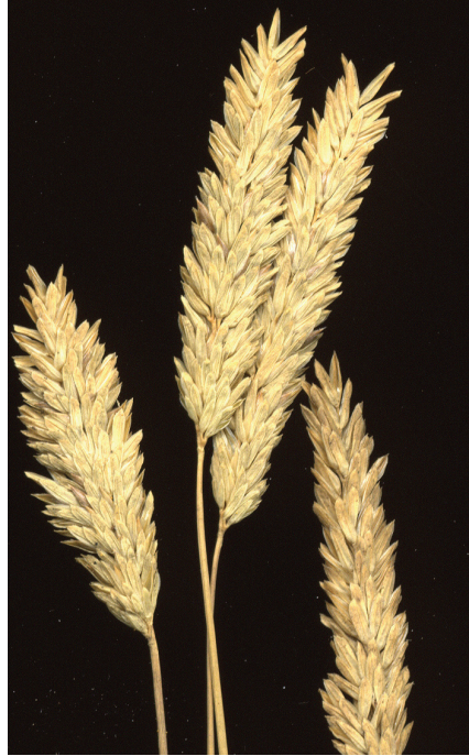
Abb. 4: Phleum subulatum subsp. subulatum , Blütenstand NHG 4576

Phleum subulatum subsp. subulatum wird bei BUTTLER (2011) als unbeständig für mehrere Bundesländer, einschließlich Bayern angegeben. Das Gras ist heimisch im Mittelmeergebiet, auf dem Balkan und der Krim. CONERT (1998) nennt als Fundort „Nürnberg 1892“ Die Belege des Herbariums vom wohl einzigen Fund aus Nürnberg stammen jedoch von 1897 (siehe auch SCHWARZ 1897 – 1912: 1897 „auf Schutt ..... zahlreich aufgetreten“) und wurden zunächst als Phleum arenarium bestimmt, aber dann rasch zu Phleum subulatum gestellt. Die Hüllspelzen des einjährigen, büschelig wachsenden Grases verjüngen sich zur Spitze hin und sind bei der vorliegenden Unterart auf dem Kiel gewöhnlich glatt (Abb.4). Das Pfriemen-Lieschgras fehlt in der Flora des Regnitzgebietes und ist daher in die Artenliste aufzunehmen.